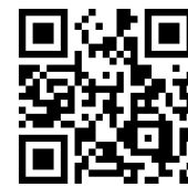
paizaレベルアップ問題集の紹介