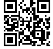
paizaレベルアップ問題集の紹介